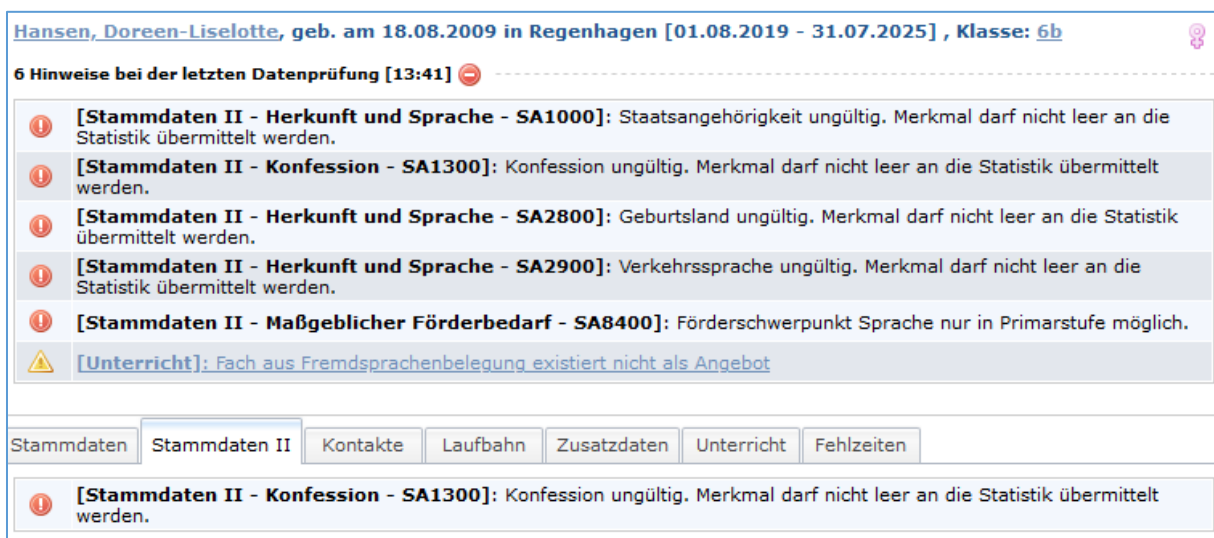
Abb. 3: Allgemeine Hinweise – Datenprüfung und Plausibilitäten im Vergleich

Sie gelangen so direkt in den ersten relevanten Datensatz und haben dann die Möglichkeit, zwischen den fehlerhaften Datensätzen zu wechseln. Damit können Sie einfach die vorhandenen Fehler abarbeiten.