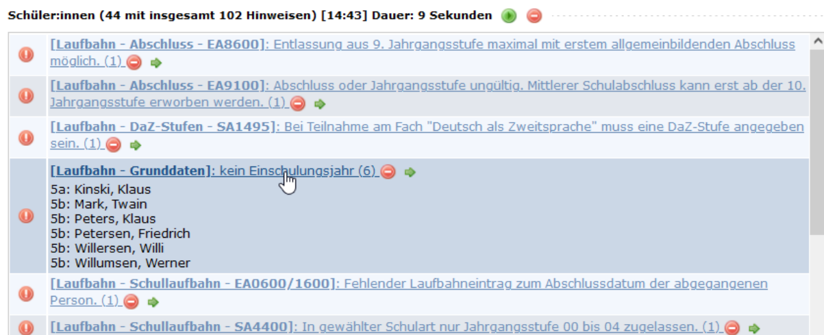
Abb. 2: Allgemeine Hinweise – Ergebnisse der Datenprüfung

Wenn Sie die Daten für die Statistik bearbeiten, ist es empfehlenswert, die Datenprüfung öfters auszuführen. Damit stellen Sie sicher, dass eingetragene Änderungen zu keinen neuen Fehlern geführt haben und erhalten eine aktualisierte Auflistung über noch vorhandene Fehler.