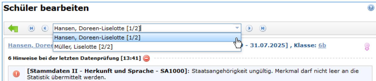
Abb. 3: Allgemeine Hinweise – Bearbeitung von betroffenen Datensätzen

Sie können in der Fehler-Übersicht auf den Fehler klicken (wie in Abb. 2 mit dem Mauszeiger dargestellt), um die betroffenen Schüler/-innen zu sehen. Wenn Sie direkt in die Bearbeitung der Datensätze übergehen möchten, drücken Sie auf den grünen Pfeil ➡ neben dem Fehlertext der Plausibilitätsprüfung.